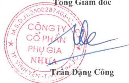
Trần Đặng Công