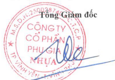
Trần Đặng Công