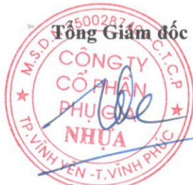
Trần Đăng Công