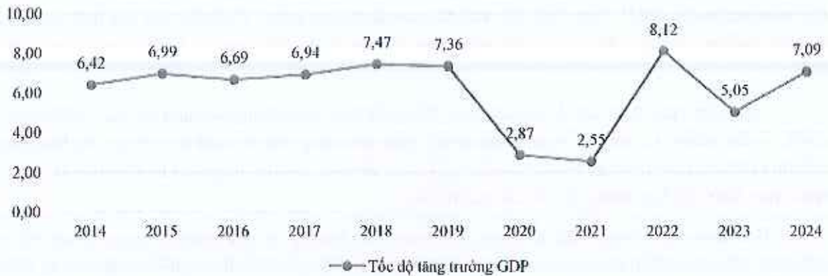
Hình 1: Tốc độ tăng trưởng GDP của Việt Nam trong giai đoạn 2014 – 2024 (%)